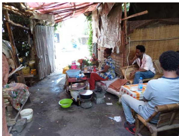
Verkoop van koffie, thee en voedsel

Weduwen. Het weduwen programma gaat gestaag door. Graag zouden wij meer weduwen helpen maar daar zijn geen middelen voor. Over het algemeen lukt het de weduwen om met hun werk zoveel te verdienen zodat zij in het levensonderhoud van hun kinderen en henzelf kunnen voorzien. Natuurlijk mislukt er ook wel eens wat. Soms werpt ziekte of een operatie roet in het eten en kan er niet gewerkt worden. Ook de traditionele vastendagen kunnen averechts werken. Toch ervaren wij dit als een goede manier om de mensen zelfwerkzaamheid te leren. Zonder hulp en advies zou het hen niet lukken.